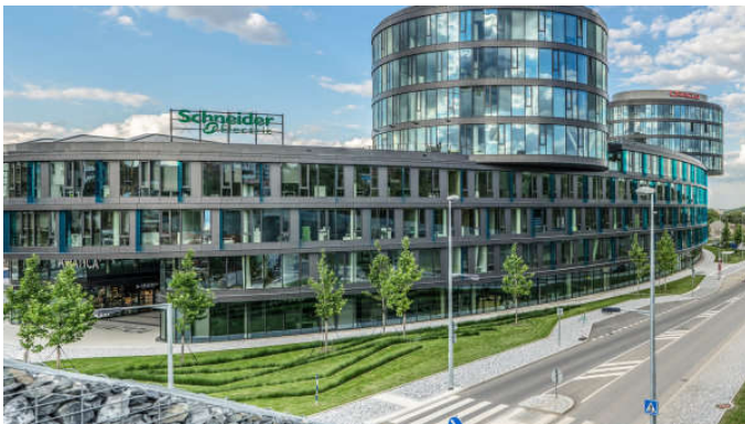
V šestém patře nové budovy Oraclu jsou relaxační zóny pro zaměstnance.

Novou budovu otevřel český Oracle v prosinci. Všude kolem ní ještě řinčí bagry a jeřáby, upravuje se okolní terén a vedle se staví další kancelářský dům. Místa pro 850 zaměstnanců firmy jsou už ale zařízená a naplno se tu pracuje. Před architekty zařízení budovy, která patří Pentě a Oracle si ji převzal do nájmu jako holou stavbu, stál nelehký úkol.